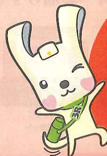
「ヨコハマ3R夢(スリム)」 マスコット イーオ

まとめ買いしたものや頂き物など、ご家庭に眠っている食品の在庫と期限を定期的にチェック！消費できない食品は、フードバンク団体等が行う食料支援につなげましょう！